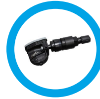
Black Aluminum Clamp-In Part #33610