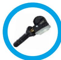
Rubber Snap-In Part #33500

¡10% de descuento adicional para 30 o más sensores!